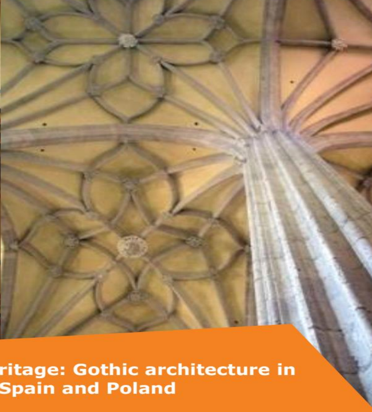
Tangible heritage: Gothic architecture in Spain and Poland